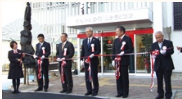
仙台長町支店 新店舗オープン

新しくなった仙台長町支店および仙台コンサルティングステーションは、地域のお客さまの復興支援に全力で取り組んでまいります。