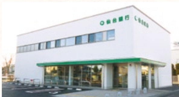
将監支店 新店舗オープン

支店内には「泉住宅ローンプラザ」を新設。住宅ローンの専門スタッフが、様々なローン相談に丁寧・迅速に対応しています。住宅ローンプラザは、土日（祝日除く）も営業中。お気軽にご来店ください。