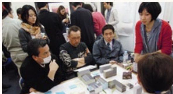
平成24年度助成先コンパクトシティいしのまき・街なか創生協議会

今後も当行は、被災地の住民コミュニティの再生を支援し、ふるさとの復興に貢献してまいります。