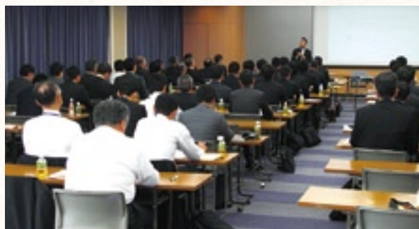
平成24年11月 きらやかターンアラウンド・パートナーズ㈱セミナー

また、共同研修会で事業再生ノウハウのレベルアップに努め、人材育成にも取り組んでいます。