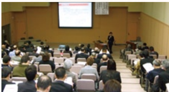
平成24年12月 事業承継セミナー

今後も、当行と中小機構東北本部は、連携活動事業をより一層強化・充実させ、山形県内中小企業等の経営支援と地域経済活性化を推進してまいります。