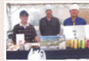
平成25年10月 卸町ふれあい市 きらやか横丁でお客さまと共に

趣味はサイクリング。特技は剣道(3段)。培った意思の強さと行動力は仕事の源です。