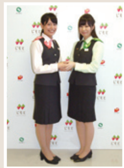
左：きらやか銀行／右：仙台銀行

製作にあたっては、東北芸術工科大学・中山ダイスケ教授（じもとホールディングスの名称・ロゴ選定をご担当）の監修のもと、両行のコーポレートカラーであるピンクとグリーンをスカーフに使用するなど、温かみと落ち着きのあるデザインを採用しました。