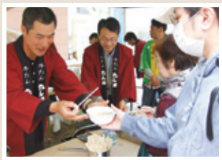
みやぎ復興感謝祭海の市の様子

当日は、先着100名にかき汁が無料配布されたほか、めかぶ・しめさば・たらこ等の水産加工品が即売され、震災を乗り越えた宮城の「海の幸」の魅力を集めた大勢の山形市民にアピールしました。