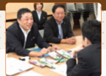
「食」の商談会 in みやぎ

じもとホールディングスは、お客さまから寄せられた事業ニーズ(商品売りたいたい・買いたい、人材が不足している)を「本業支援戦略部」に集約しマッチングすることで、新たなビジネス機会を創出し、お客さまの事業ニーズにスピーディーに対応しております。