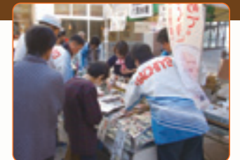
みやぎ復興感謝祭 海の市 in 山形

「東日本大震災事業者再生支援機構」への案件持込みや「個人債務者の私的整理に関するガイドライン」の活用、被災企業への協調融資の実施、被災地への支援拠点の整備、移動店舗での営業等を行い、東日本大震災で被災されたお客さまの復興を支援しております。