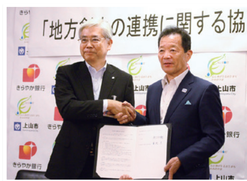
上山市との連携協定締結式

平成30年6月、地域経済の発展、地方創生に寄与することを目的として、山形県上山市と「地方創生の連携に関する協定」を締結いたしました。本協定は、「企業誘致」、「空家等及び空き地の利活用」、「産業振興及び企業・事業所・創業者の支援」など、幅広い活動に関する連携・協力を想定しており、双方が保有する情報を総合的に共有することで、地域活性化の推進を図るものです。当行は上山市を含め、これまでに4つの自治体と連携協定を結んでおります。