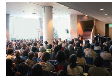
ロビーコンサート

当行は、今後も仙台市と連携を図りながら、地域の皆さまの文化活動を支援してまいります。