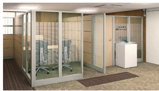
仙台銀行SBIマネープラザ

当行では、顧客本位のより良い業務運営を実現するため、さらなる商品・サービスの向上に取り組んでまいります。