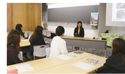
当行の取り組みについて紹介