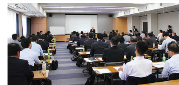
きらやか事業承継セミナー

平成30年5月、当行ときらやかコンサルティング&パートナーズ（KCP）は、近年ニーズが高まっている事業承継を支援する活動の一環として、「きらやか事業承継セミナー」を開催いたしました。本セミナーは、外部専門家を講師としてお招きし、お取引先企業さまを対象に、事業承継の基礎知識から、今年度改正された事業承継税制の注意点等に至るまで、幅広い知識を習得していただくことを目的に企画したものです。