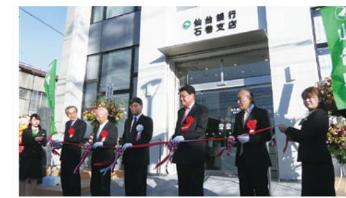
リニューアルした石巻支店

当行では、引き続きお客さまの利便性向上、質の高いサービスの提供に積極的に取り組んでまいります。