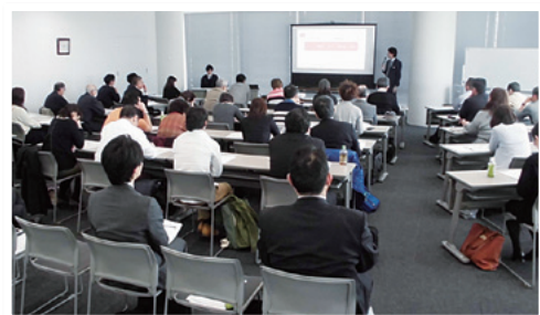
キャッシュレス決済導入セミナー

当行では、今後もお取引先の経営課題解決に向けた本業支援に積極的に取り組んでまいります。