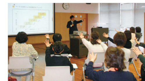
きらやかレディースセミナー

2018年2月、当行ときらやかコンサルティング&パートナーズが東北文教大学と連携し「きらやかレディースセミナー」を開催いたしました。本セミナーは、「きらやか人材育成プログラム」の一環として毎年テーマを決めて行っており、今回が3回目の開催となりました。今回は、介護と仕事の両立の秘訣や実技を取り入れた「運動×脳トレで認知症・介護予防」の講義が行われ、講義後のグループワークではコーヒーとスイーツを楽しみながら活発な意見交換が行われました。