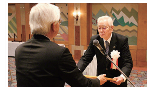
きらやか産業賞・ベンチャービジネス奨励賞贈呈式

2019年3月、「第30回きらやか産業賞」および「第23回ベンチャービジネス奨励賞」の贈呈式を執り行いました。30回目という節目の年を迎えた「きらやか産業賞」は、技術や経営の革新・国際化・教育訓練の面で特に優れた実績を挙げている県内の中小企業と団体・個人を対象に表彰を行っており、また「ベンチャービジネス奨励賞」は、特に将来性があり、新技術・新製品などの研究開発を行う中小企業と関連団体・研究成果による起業を予定している個人・団体に対し、地元産業の活性化を目的に毎年選出・表彰を行っております。