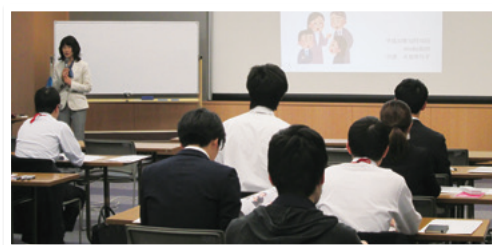
新入社員フォローアップ研修

当行ときらやかコンサルティング&パートナーズでは、お取引先企業の人材育成支援の一環として、毎年春に「新入社員研修」を実施しております。その後、職場の雰囲気や仕事に慣れ始める一方で社会人としての悩みや問題意識が芽生えてくる秋頃を目処に、ビジネスマナーの再確認とコミュニケーション力の向上を目指し、ロールプレイング等を交えたフォローアップ研修を実施しております。