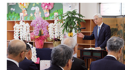
出羽学童保育所第4受楽園開所式（旧漆山支店）

地域貢献活動の一環として、山形市にある旧漆山支店を、宗教法人浄土院様に寄贈し、新たに「出羽学童保育所第4受楽園」に生まれ変わった同所の開所式が2018年12月に執り行われました。今般の寄贈は、地域住民から寄せられた出羽地区の学童保育所定員超過の声に対し、出羽学童保育所運営委員会が山形市の委託を受け、当行の旧漆山支店を学童保育事業に活用したものです。