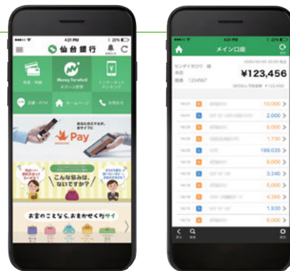
仙台銀行アプリイメージ

当行は、引き続きお客さまにより便利にご利用いただける様々なサービスを提供してまいります。