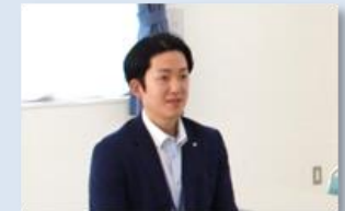
第1号となったお客さまと担当した 当行職員がテレビで紹介されました。