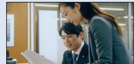
創業70周年記念CM「この街のためにできること」編